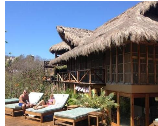
El Alquimista Yoga Spa