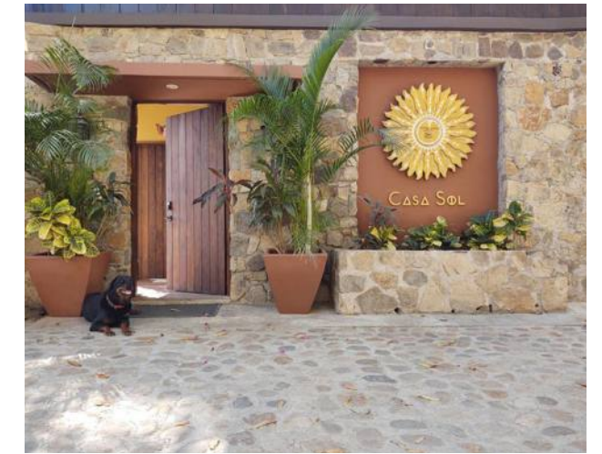
Casa Sol Zipolite